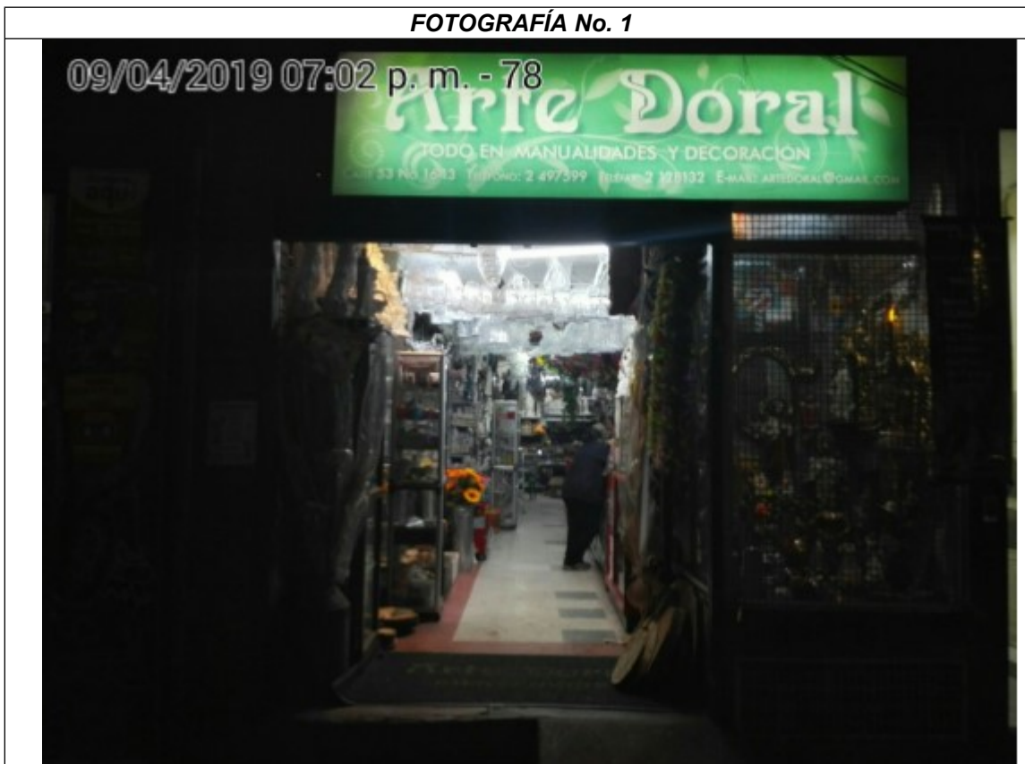
Fotografía panorámica del establecimiento de comercio ARTE DORAL, donde se evidencia los incumplimientos anteriormente descritos.