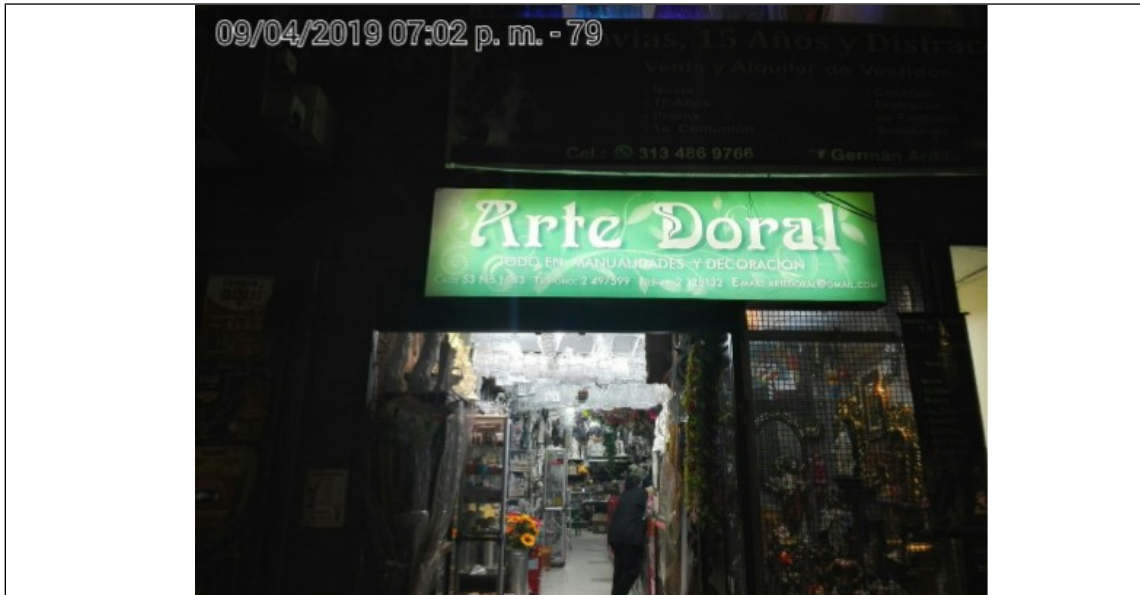
Fotografía panorámica del establecimiento de comercio ARTE DORAL, donde se evidencia los incumplimientos anteriormente descritos.